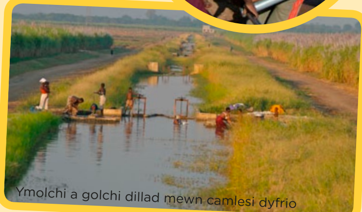
Ymolchi a golchi dillad mewn camlesi dyfrio